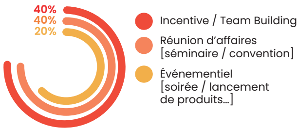
Source : Sondage auprès des professionnels italiens du MICE, 2023-2024