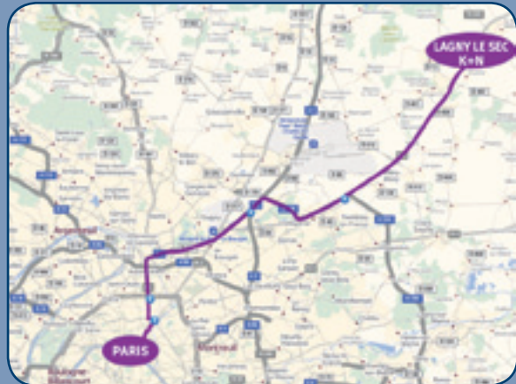
L'implantation du site logistique de K+N se trouve à 40 km de Paris et à 15 km de Roissy CDG

Horaires de réception : de 8h à 15h30 (du lundi au vendredi)