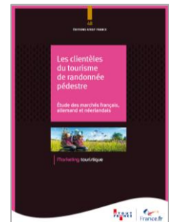
Les clientèles du tourisme de randonnée pédestre Collection Marketing touristique Atout France – Mars 2019

L'étude menée par Atout France et ses partenaires dresse le portrait des clientèles du tourisme de randonnée pédestre sur chacun des 3 marchés et identifie 3 profils de randonneurs : les Sportifs, les Hédonistes et les randonneurs « Détente ».