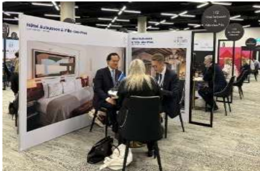
Exemple stand simple « Boutique STUDIO »