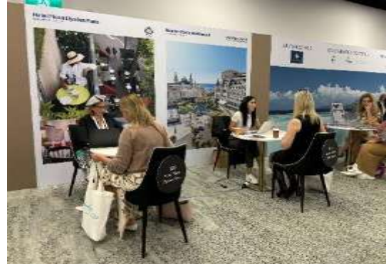
Exemple stand Group suit