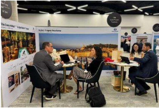
Exemple stand double stand « Boutique STUDIO »