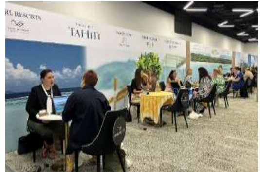
Exemple stand Group suit