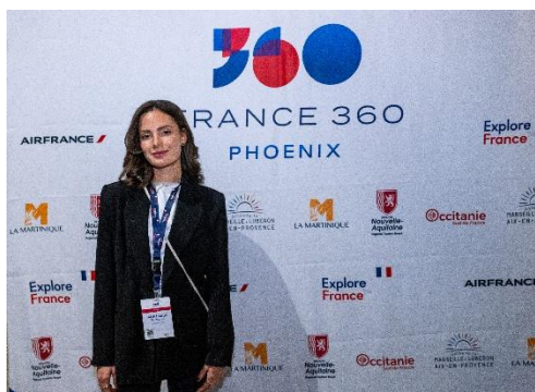
Photocall logos sponsors