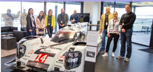
Corporate Hospitality Porsche Experience Center au Mans