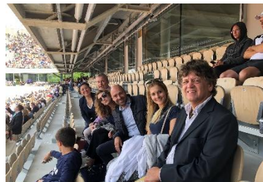
Corporate Hospitality Roland Garros