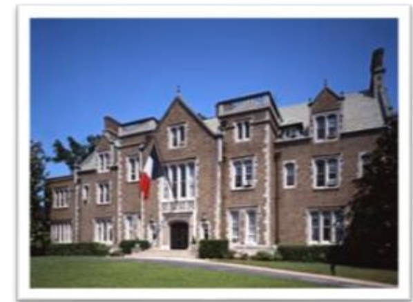
Résidence de France, Washington DC

Grâce à notre lien avec les réseaux consulaires, nous proposons lors de ce roadshow un workshop b2b à la Résidence de l'Ambassadeur , lieu prestigieux , à Washington DC.