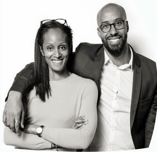
Brother & Sister