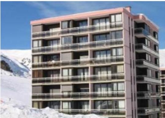
Le Goléon - La Toussuire (Alpes du nord)

Exemple de deux copropriétés accompagnées en AMO dans le cadre du programme FTI Rénovation des stations