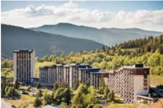
Le Balcon de Villard Villard-de-Lans (Alpes du nord)

Le colloque Régénération Montagnes a ouvert sur le bilan de cinq années d'expérimentation sur la rénovation de l'immobilier en montagne aux côtés de nombreux territoires déjà convaincus et engagés bien avant les évolutions législatives. Il a démontré concrètement que les acteurs de terrain ont commencé à développer des méthodes et des outils d'intervention pour lancer des rénovations conciliant transition et dynamisme de l'activité économique.