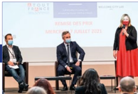
Cérémonie de remise de prix « Challenge Tourisme Innov' 2021 »

MODALITÉS D'ACCÈS ET TARIFS DÉTAILLÉS EN PAGE 22