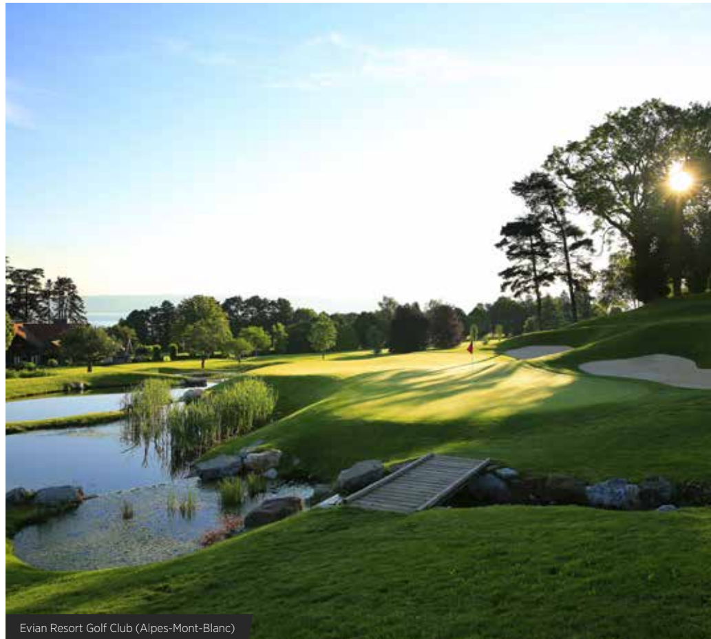
Evian Resort Golf Club (Alpes-Mont-Blanc)