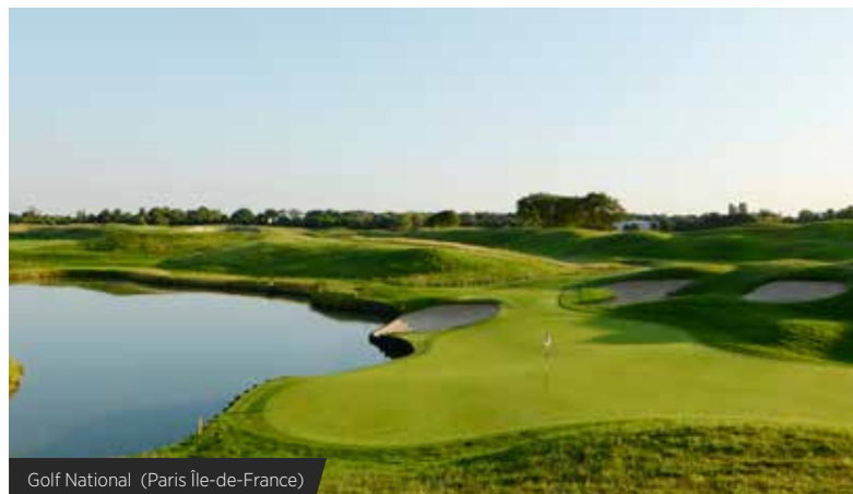
Golf National (Paris Île-de-France)

Elle valorise ainsi prioritairement certains resorts golfs, identifiés pour leur excellence et leur prise en compte des touristes, afin de mettre en avant la thématique à l'international. Leur exemple doit permettre d'entraîner les autres acteurs de la filière dans leur sillage.