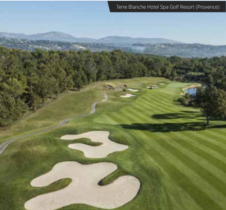
Terre Blanche Hotel Spa Golf Resort (Provence)

Le golf de Biarritz le Phare, situé au cœur de la ville de Biarritz, est le témoin de l'histoire du golf en France autant que de la tradition sportive du Pays Basque. Doté de 18 trous, il offre une situation exceptionnelle au bord de l'océan et en plein centre ville. En l'espace d'un siècle, Biarritz est entrée dans la légende du golf, a accueilli de nombreuses épreuves internationales, a vu émerger de grands champions et a essaimé autour d'elle bien d'autres parcours réputés.