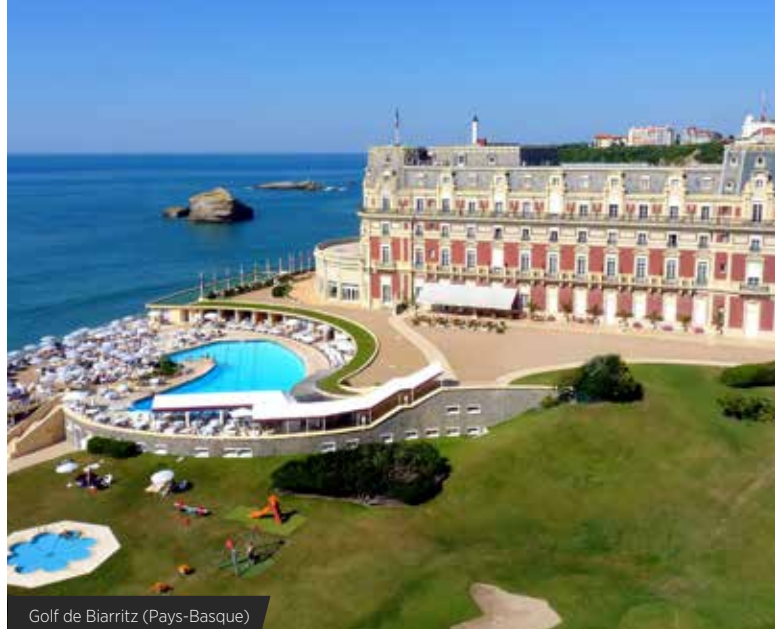
Golf de Biarritz (Pays-Basque)

Le resort propose également un hôtel & spa MGallery by Sofitel.