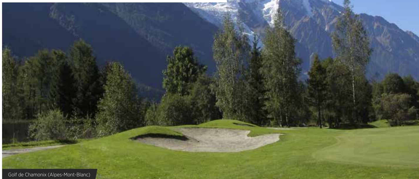
Golf de Chamonix (Alpes-Mont-Blanc)

Première destination touristique mondiale, la France dispose de sérieux atouts pour attirer les golfeurs du monde entier mais ce potentiel est encore insuffisamment connu.