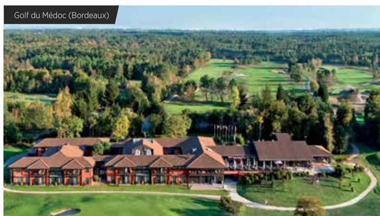
Golf du Médoc (Bordeaux)