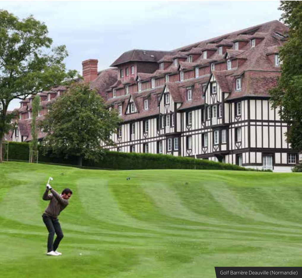
Golf Barrière Deauville (Normandie)