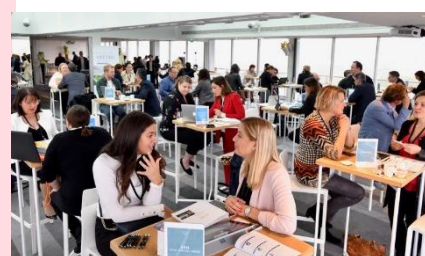
Workshop au Pullman Tour Eiffel