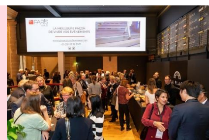
Lancement de l'événement au Palais Brongniart

Événement organisé en partenariat avec Accor, France Galop, Hôtel de Crillon, Ikabena Experiential Events, Holt DMC France et Ducasse Paris