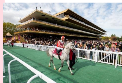
Journée course hippique à Paris Longchamp coordonnée par France Galop.